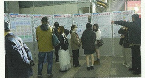
宮城学院女子大学 アエルでの展示の様子（令和7年11月）

終戦80年の令和7年度に宮城学院女子大学で心理学を学ぶ1年生が仙台空襲と向き合いました。当時の新聞や雑誌記事の見出しをデータベース化して分析し、空襲の背景や防空壕、終戦後の仙台の復興について考察を加えました。