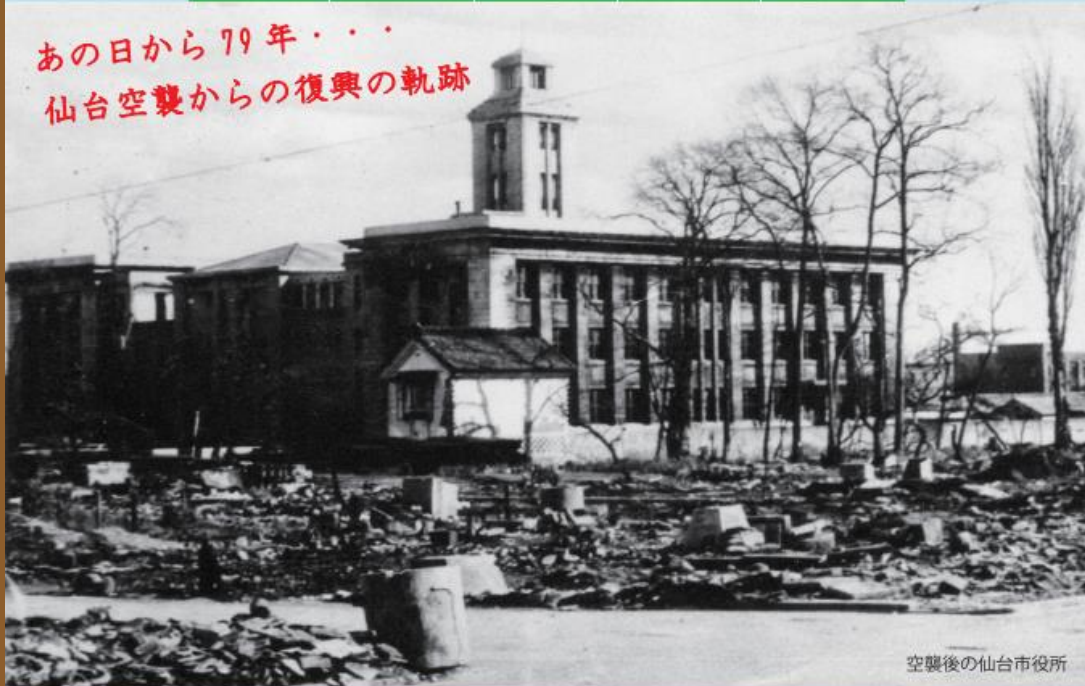
空襲後の仙台市役所