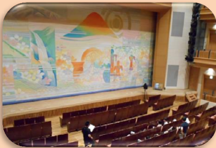
①この緞帳には何が描かれているのかな？