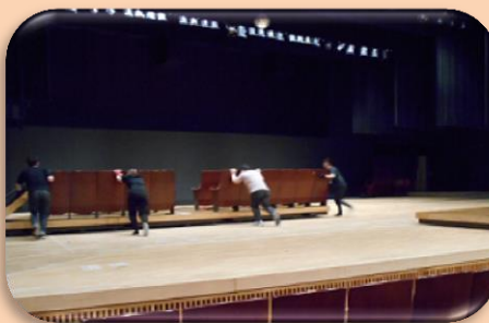
⑦どんどん舞台の形が変わっていきました。