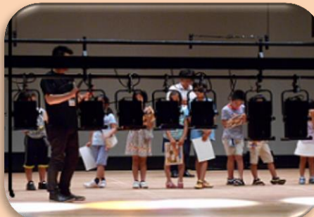
⑤いつもは天井にある照明器具。身近で見ると、大きいね！