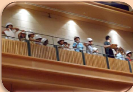
④高いところもへっちら！