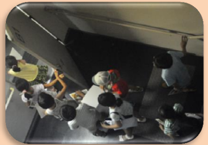
③この階段はどこまで続いているのだろう・・・。