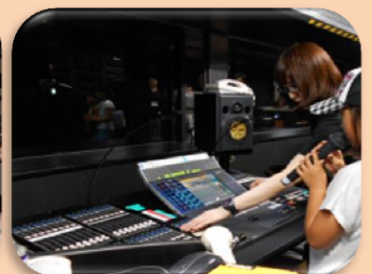
⑥マイクを使って音の変化。あれ？いつもと声が違う？