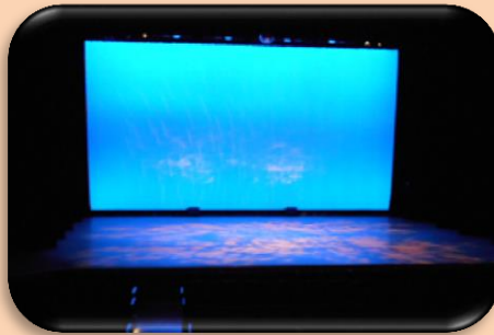
②幕があいたら、きれいな舞台が！どうやってつくるのかな？