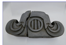
(焼けた養賢堂の瓦)

「戦時中の暮らし」をテーマに、戦災復興記念館資料展示室展示品の一部を展示します。