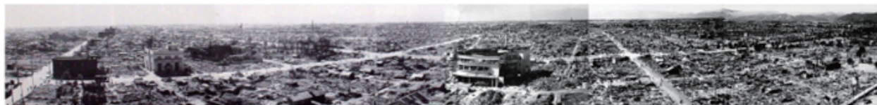
岐阜市市街地焼け跡パノラマ写真