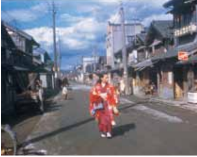
宣教師が撮影した仙台市内(田町)