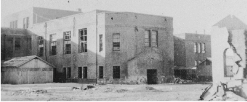
被災した校舎(東二番丁)