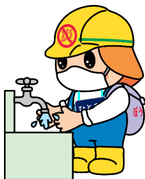
こまめな手洗い・うがい