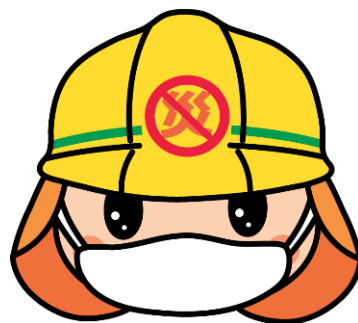
職員のマスク着用