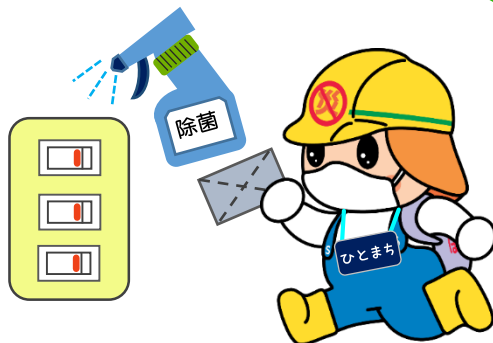
館内各所の消毒の実施