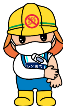
職員の毎日の体調チェック