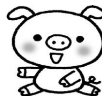
当館キャラクター「とんぼー」