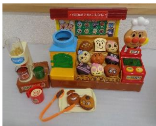
アンパンマンのおもちゃや...