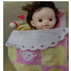
ぽぽちゃんもいるよ!