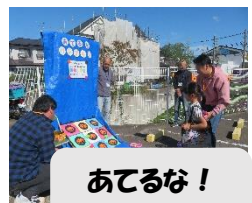
あてるな! パンフキン