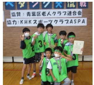
10/6(金)「ちびっこひろば」

『ママさんプラスぴよぴよ音楽隊』の皆さんによるオープニングや、コーナー遊びを楽しみました。