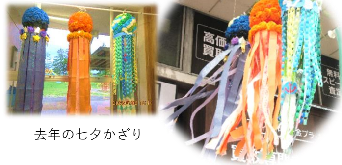
去年の七夕かざり