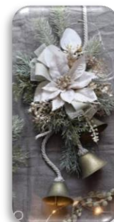
完成イメージです♪