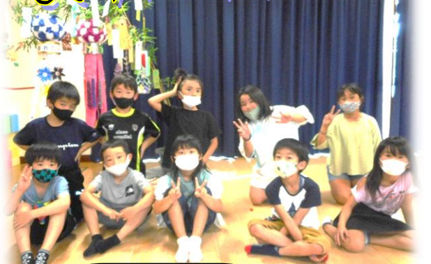
児童クラブの様子