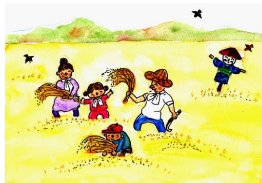
市民センターまつりのテーマイラスト