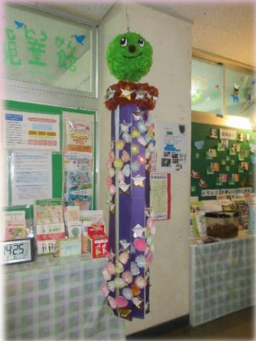
児童館に展示された七夕飾り