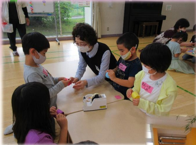
折り方を教わる子どもたち